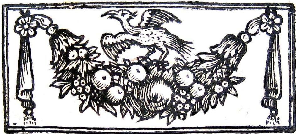
III. tratta da: Caspoggio-27/I